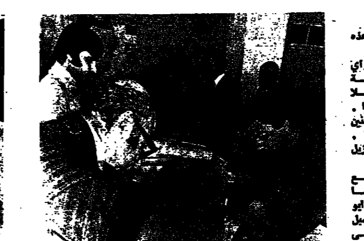
مهندسون يعملون على الخرائط

ويصف الخرائط بكونها تدرس إمكانية توفير واستثمار هذه المبالغ في فترة قصيرة. ورداً على سؤال حول كيفية تأمين الأموال لعمل ذلك، أجاب المحافظ: إن قضية تأمين المال تتجدي بالتشاور والتشاور مع مجلس الآباء والأمهات الذي أوكل إليه أمر تأمين المال للمشروع في لبنان.